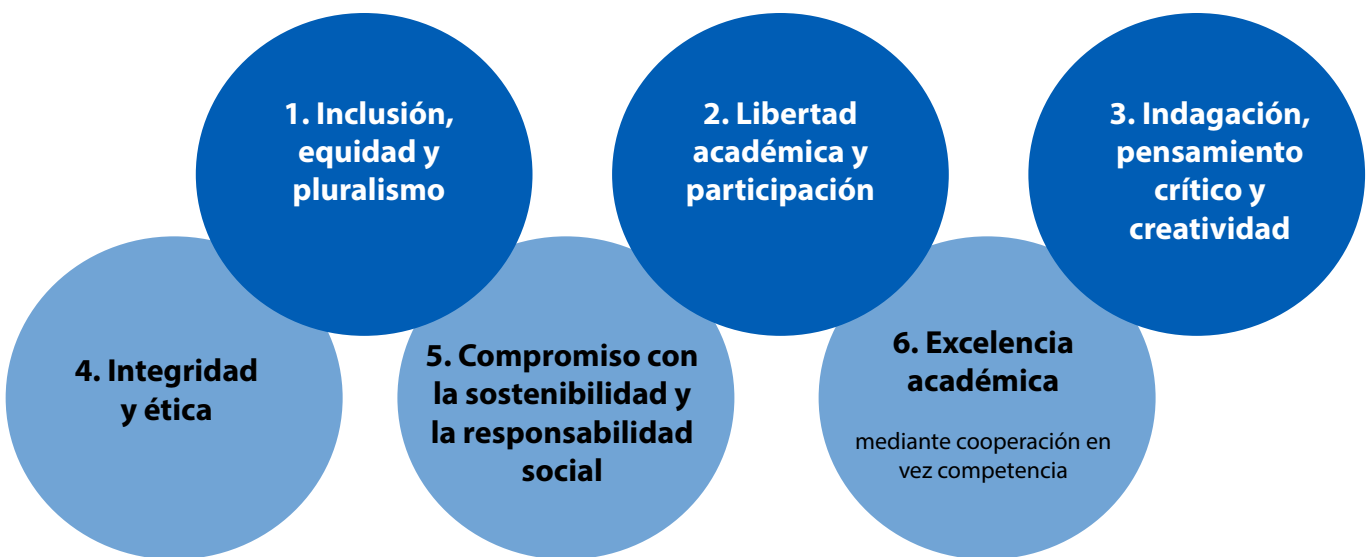
Figura 1. Principios para configurar el futuro de la educación superior

Bajo el marco general de ser un componente del derecho a la educación y cumplir una misión de bien público alineada con los ODS, los sistemas e instituciones de educación superior pueden guiarse por seis principios clave de cara a 2030, construyendo un nuevo contrato social para la educación superior, tal y como se propone en el Informe sobre los futuros de la educación (véase la figura 1).